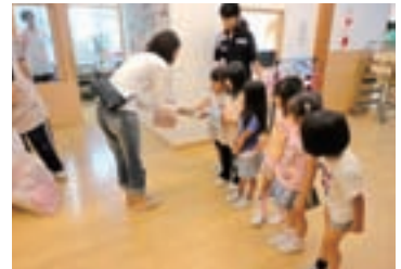
盛岡市かがの保育園の園児たちが作ったプレゼントを嬉しそうに受け取る、釜石市の中妻子どもの家保育園の園児たち