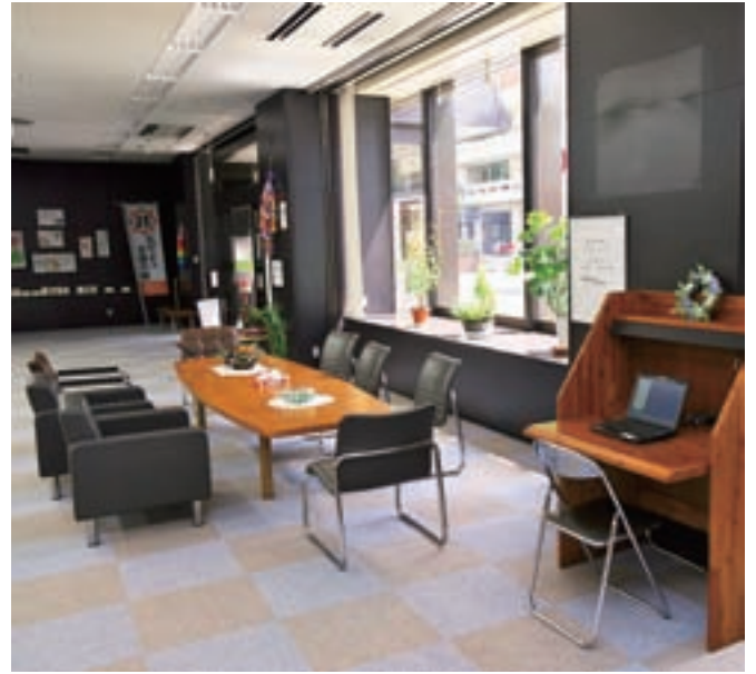
① 広々としたセンター内には、ゆっくり話せるスペースが。ときにはお茶会なども開催されている。 ② 「どこに何を相談したらいいかわからない」という状態でも気軽に相談窓口立ち寄りしてほしい。