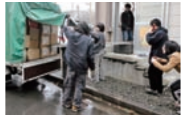
岩手大学の教授が中心となって、沿岸の高校に辞書・文具などを送る際の出発の様子