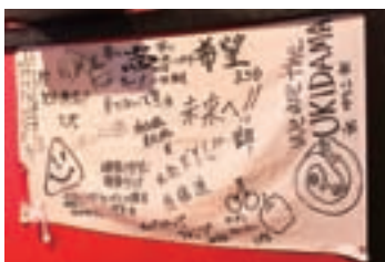
お客さまから寄せられた復興を祈るメッセージ

いわての沿岸部で震災に直面し、 愛着のある地元を離れ、 盛岡で再出発の 第一歩を踏み出した人たち。 また、盛岡から復興支援の 実践に取り組んでいる人たちもいる。 彼らの思いを知ることから、 私たち一人ひとりができる 復興応援の方法を探しはじめよう。