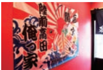
店内には漁船の旗が飾られていて、港町を連想させる